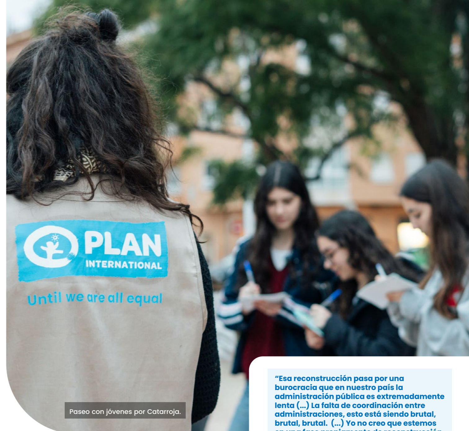
Paseo con jóvenes por Catarroja.

La sensación de cierta mejora, al menos en la rehabilitación de los servicios y recursos básicos, convive con la percepción de que la situación sobrevinida en las administraciones públicas, la ausencia de protocolos y procedimientos para actuar ante este tipo de catástrofes y los procesos burocráticos han dado como resultado una reconstrucción