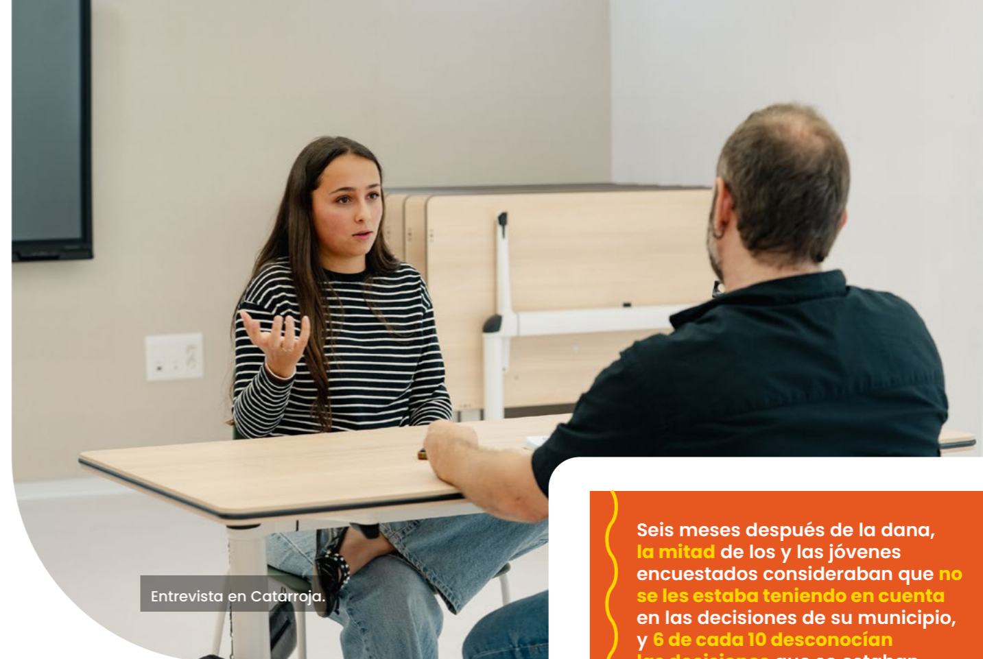
Entrevista en Catarroja.

Consideran que una vez pasada la situación de primera emergencia, en la que se requerían los esfuerzos de toda la ciudadanía, no se les