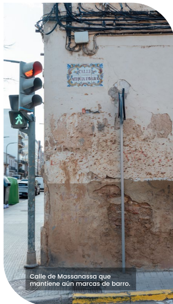
Calle de Massanassa que mantiene aún marcas de barro.

■ Técnica municipal de urbanismo y territorio.