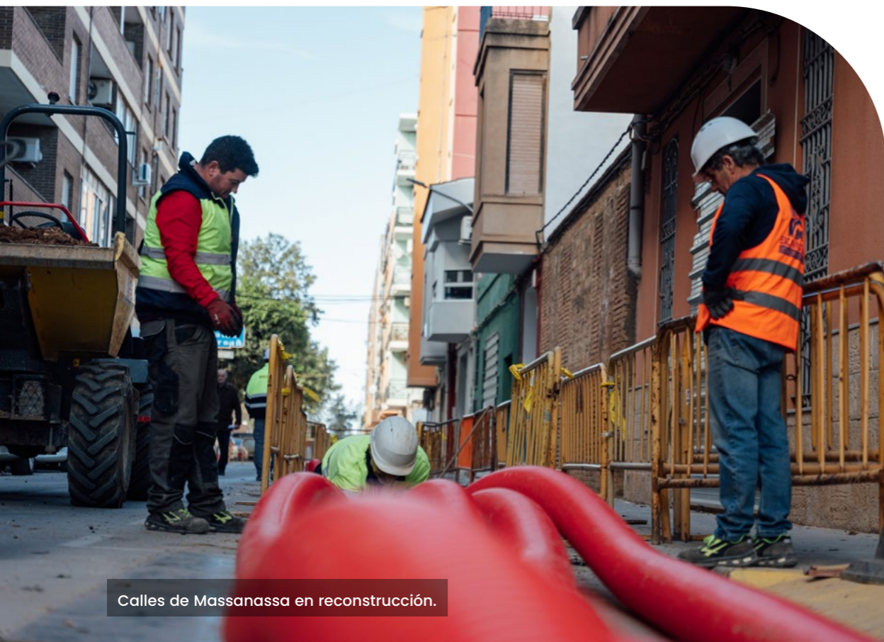
Calles de Massanassa en reconstrucción.

Las opiniones recogidas en este informe ponen sobre la mesa esas diferencias que existen entre la percepción y las necesidades y demandas de una parte de la ciudadanía y los ritmos y prioridades marcadas en las agendas de las instituciones políticas responsables de la gestión de la reconstrucción.