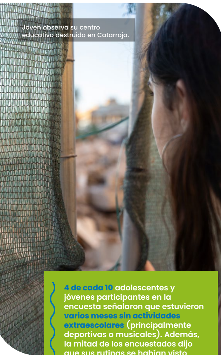
Joven observa su centro educativo destruido en Catarroja.

4 de cada 10 adolescentes y jóvenes participantes en la encuesta señalaron que estuvieron varios meses sin actividades extraescolares (principalmente deportivas o musicales). Además, la mitad de los encuestados dijo que sus rutinas se habían visto bastante afectadas los meses posteriores. El 31% de ellos y ellas dijo que sus relaciones sociales habían disminuido .