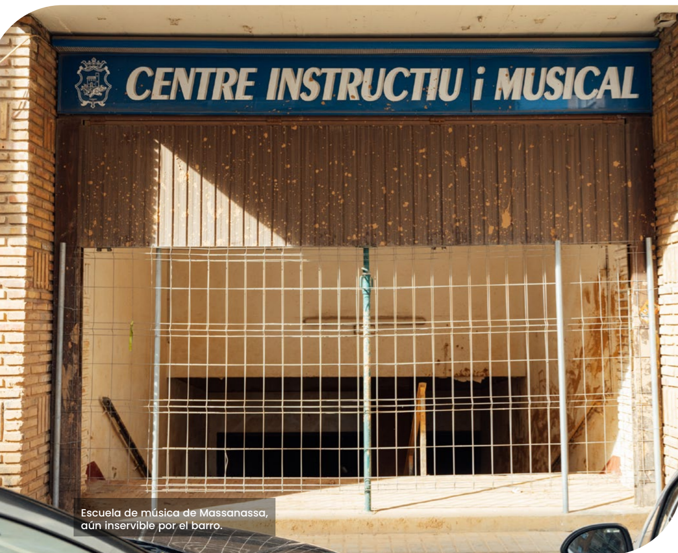
Escuela de música de Massanassa, aún inservible por el barro.

“Las personas que se envían de refuerzo pues vienen sin poder acceder a los sistemas de grabación de datos o a los sistemas de manejo de dependencia o de renta valenciana. Entonces, bueno, adelantan faena, sí, pero bueno, al final se paran en el mismo sitio porque sigue habiendo una persona interna que tiene que grabar todo eso en los sistemas”.