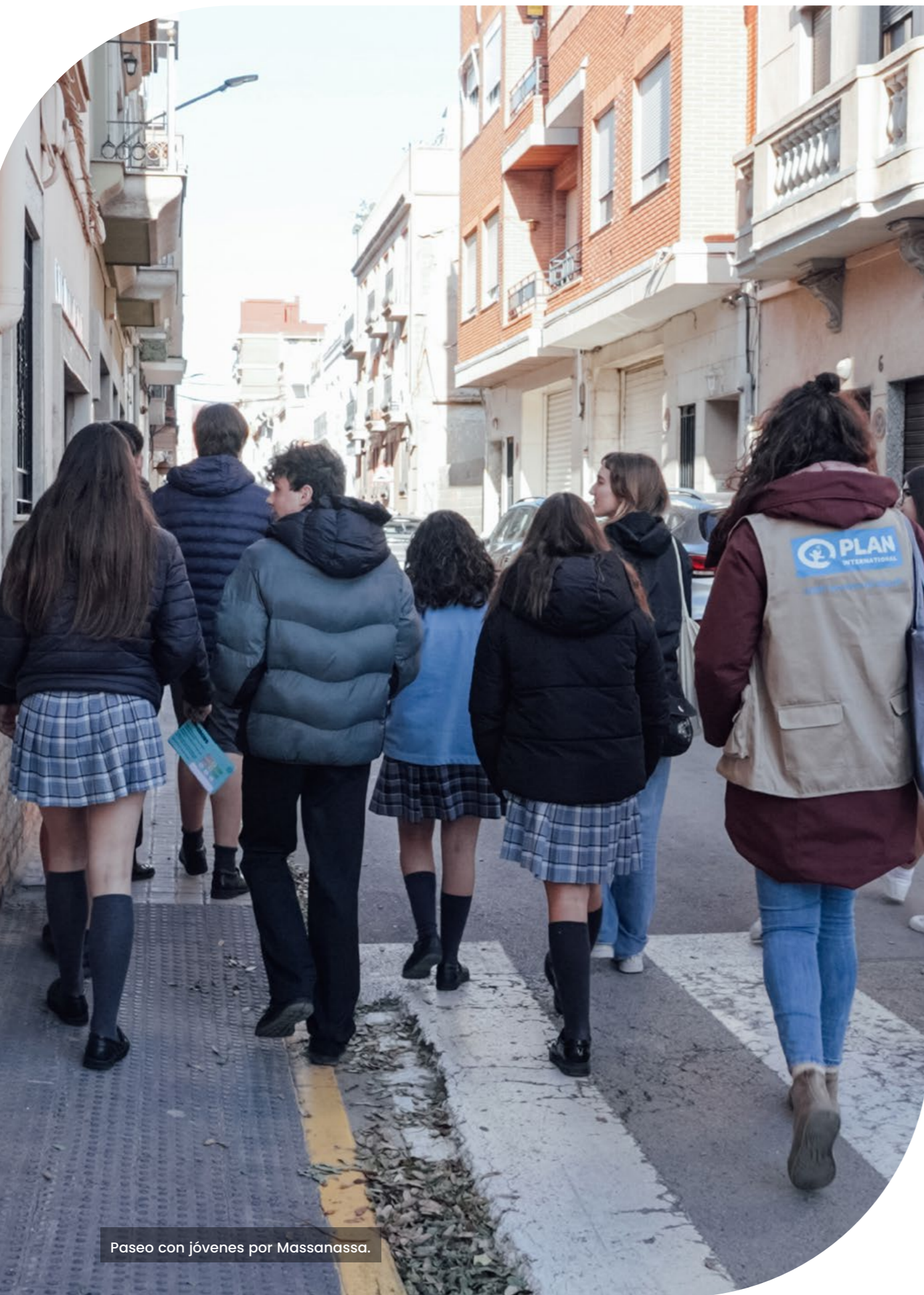
Paseo con jóvenes por Massanassa.