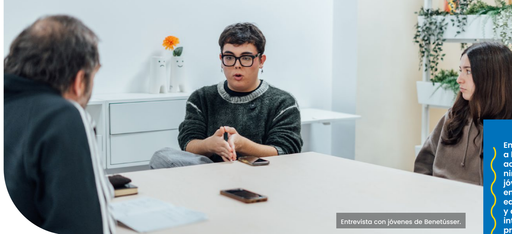
Entrevista con jóvenes de Benetússer.

El enfoque Build Back Better (BBB) plantea aprovechar la recuperación tras un desastre para fortalecer la resiliencia de comunidades y países, por medio de la integración de medidas de reducción de riesgos en infraestructuras, sistemas sociales, economía, medios de vida y medio ambiente. La Oficina de las Naciones Unidas para la Reducción del Riesgo de Desastres (UNDRR) y el Marco de Sendai recalcan la importancia de incluir a niños y jóvenes en la reducción del riesgo de desastres 16 teniendo en cuenta su capacidad como agentes de cambio; se debe promover su participación adaptando espacios y procesos con arreglo a la legislación, la práctica y los planes de estudios para que sean incluidos en la toma de decisiones que les afectan en este ámbito. También, este enfoque BBB debe ser