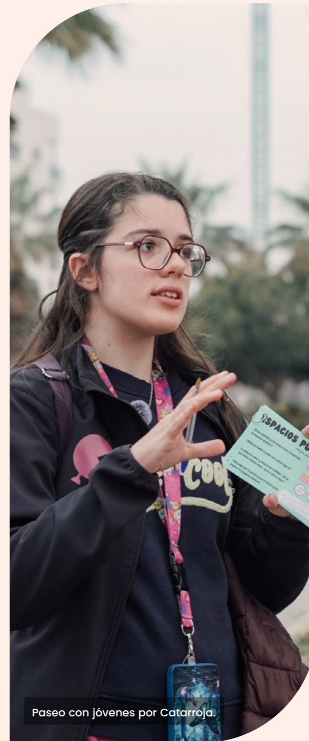
Paseo con jóvenes por Catarroja.