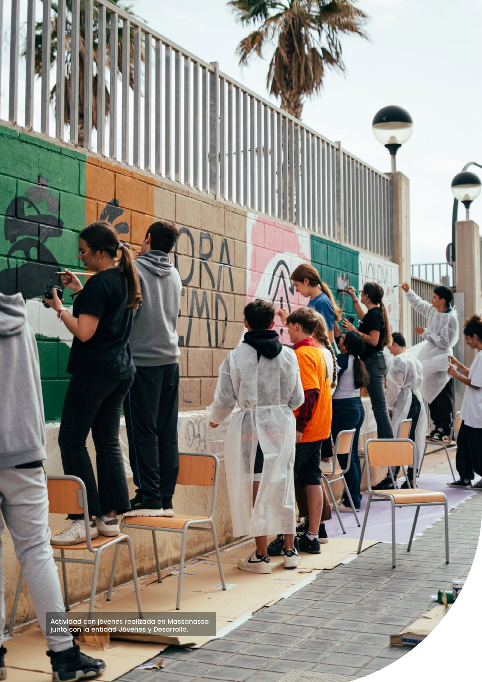
Actividad con jóvenes realizada en Massanassa junto con la entidad Jóvenes y Desarrollo.

En definitiva, existe una visión generalizada sobre el impacto socioeducativo de la dana y sobre la necesidad de priorizar y agilizar la recuperación de la infraestructura y los servicios educativos, considerándolos como un elemento imprescindible para un colectivo especialmente vulnerable.