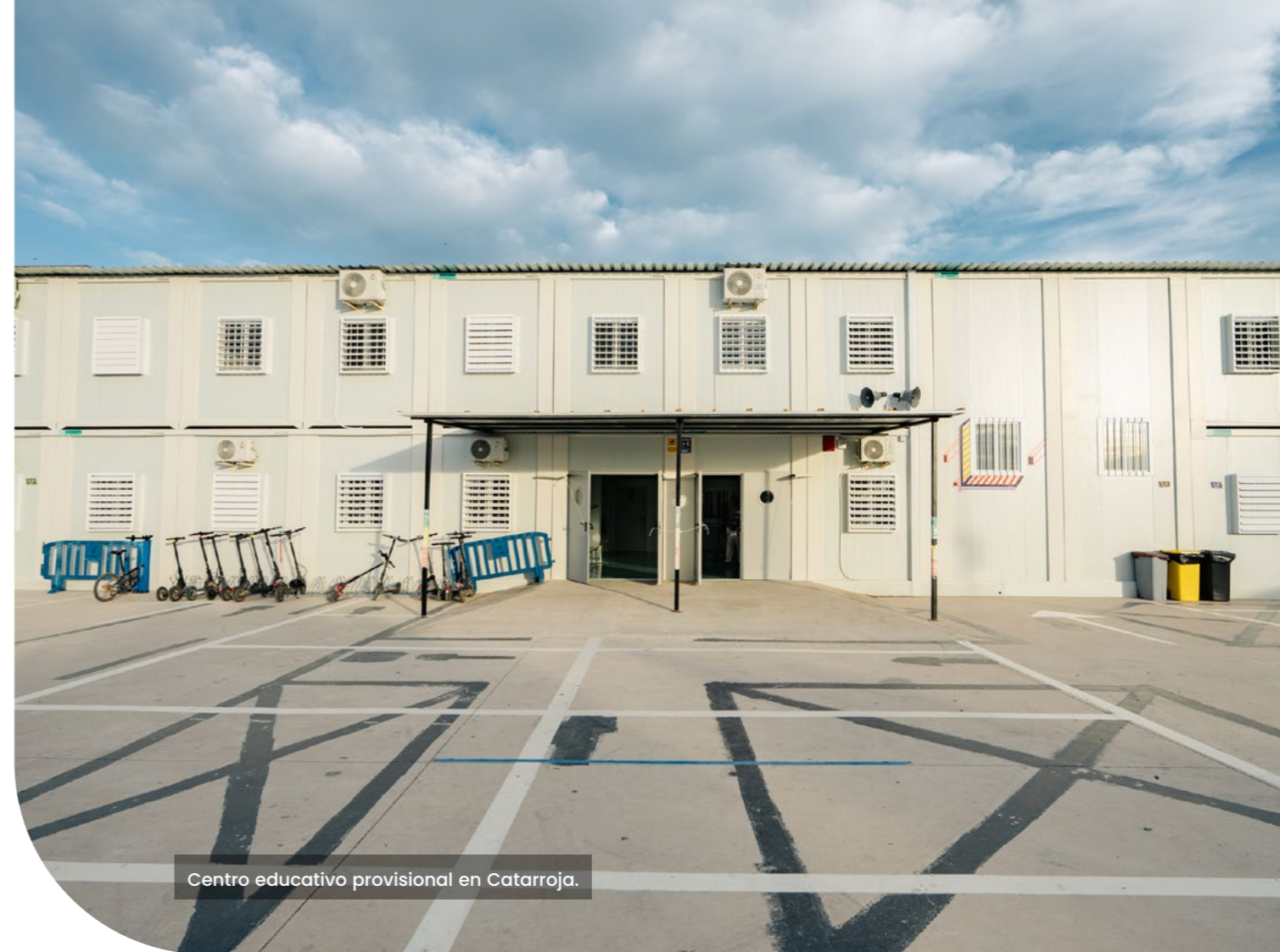
Centro educativo provisional en Catarroja.

Adolescentes en crisis: impactos de la dana (Plan International, 2025).