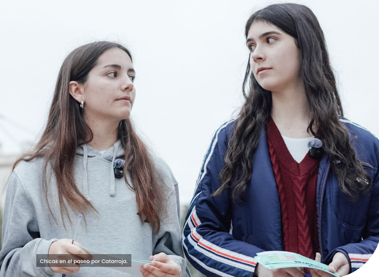
Chicas en el paseo por Catarroja.

“Las ayudas supongo que siempre tardan mucho, nunca son instantáneas, pero sí, se van recibiendo las cosas”.