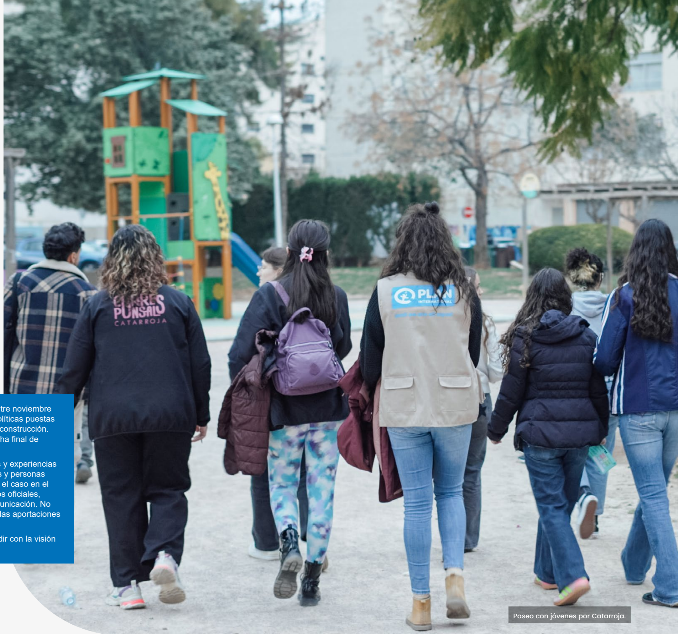
Paseo con jóvenes por Catarroja.

Las opiniones de las personas entrevistadas no tienen por qué coincidir con la visión de Plan Internacional.