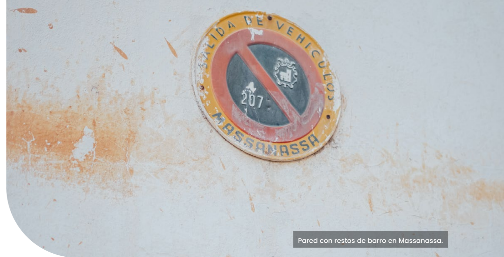
Pared con restos de barro en Massanassa.

La reconstrucción debe tener en cuenta también la perspectiva de la educación desde el punto de vista de la resiliencia climática. En este punto es clave aplicar el Marco Integral de Seguridad