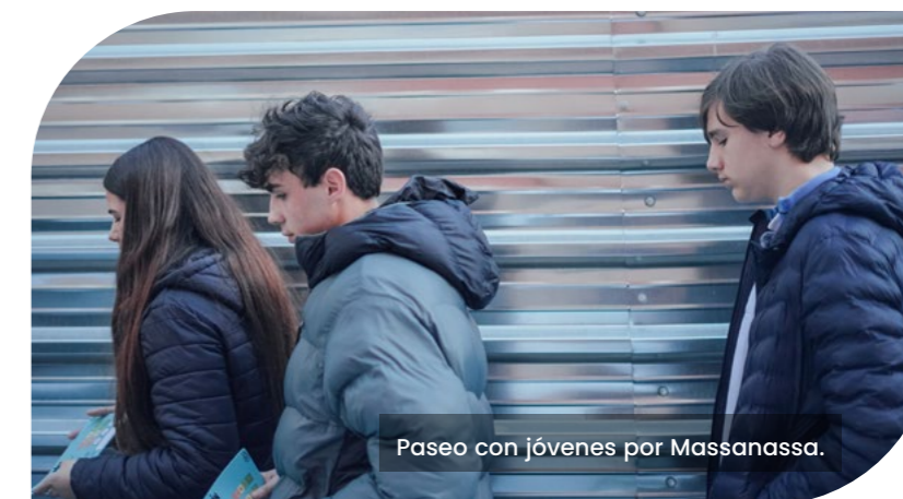
Paseo con jóvenes por Massanassa.

“Nosotros empezamos secundaria con el COVID y hemos acabado con una dana”.