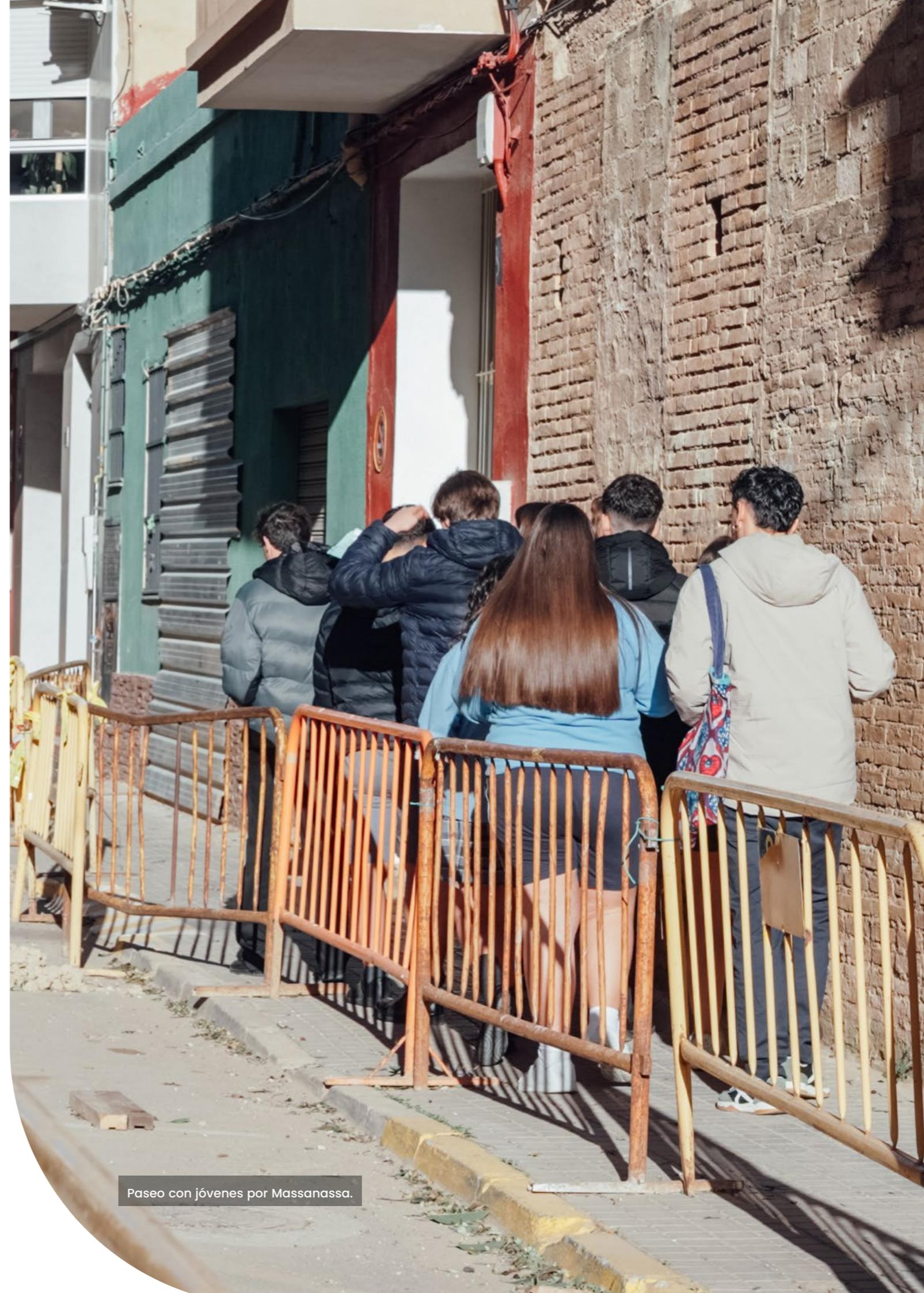
Paseo con jóvenes por Massanassa.