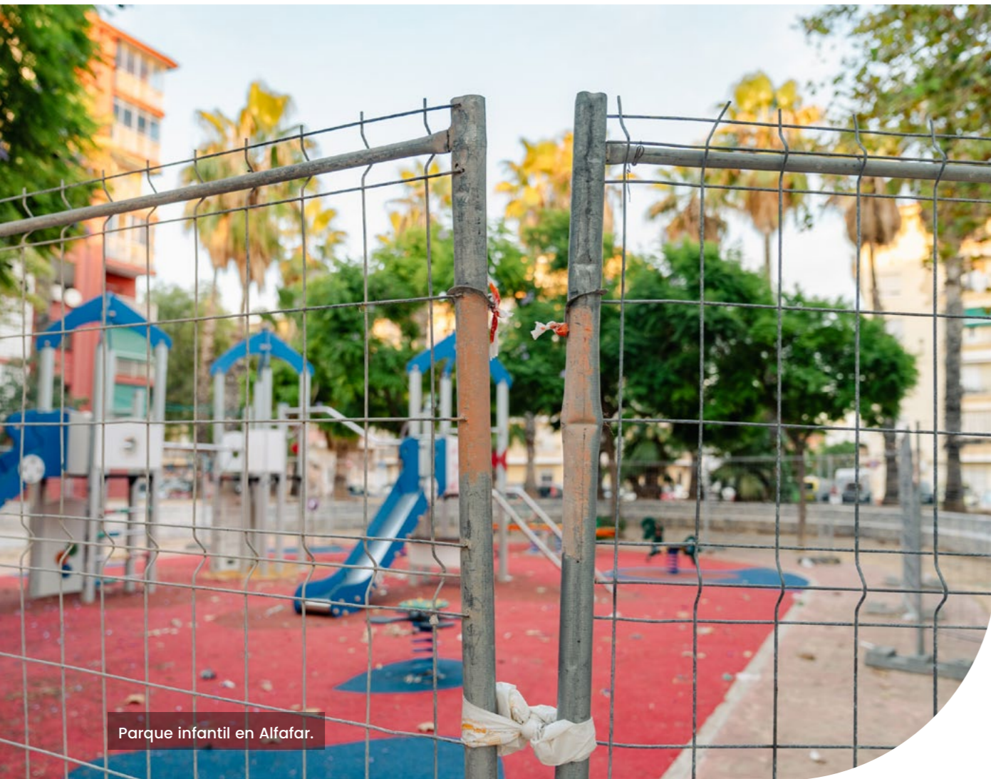
Parque infantil en Alfafar.

Finalmente, el proceso de reconstrucción adolece de una perspectiva de género que integre un diagnóstico de las necesidades específicas de las mujeres jóvenes, que tampoco están reflejadas en los marcos normativos de forma diferenciada, según expertas, pese a que diversos estudios demuestran que las catástrofes climáticas no son neutras en términos de género 33 y afectan de manera diferente a niñas, adolescentes y mujeres: aumentan el riesgo de situaciones de violencia sexual y de género, dificultan el acceso a servicios de salud sexual y reproductiva y suelen provocar una sobrecarga del trabajo de cuidados.