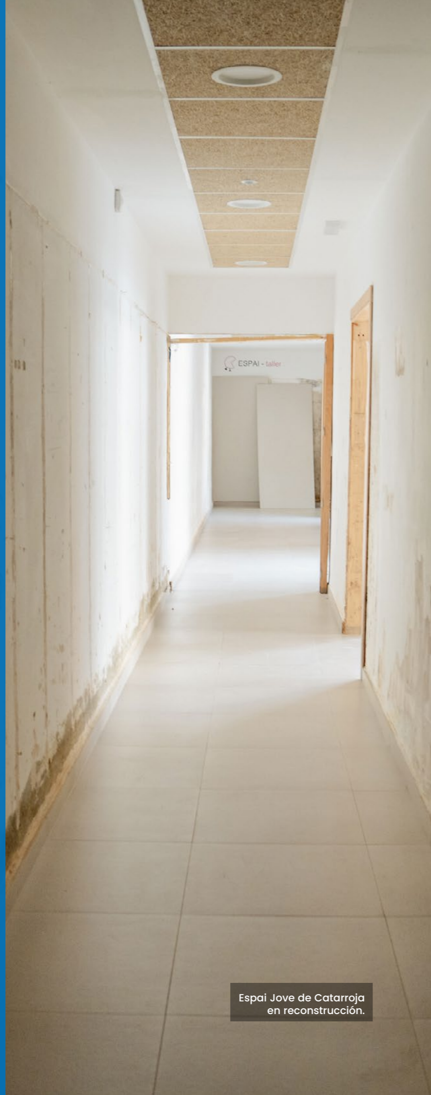
Espai Jove de Catarroja en reconstrucción.